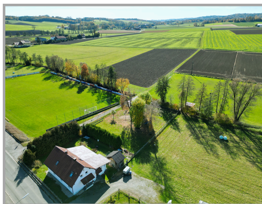
Ansicht aufs Haus