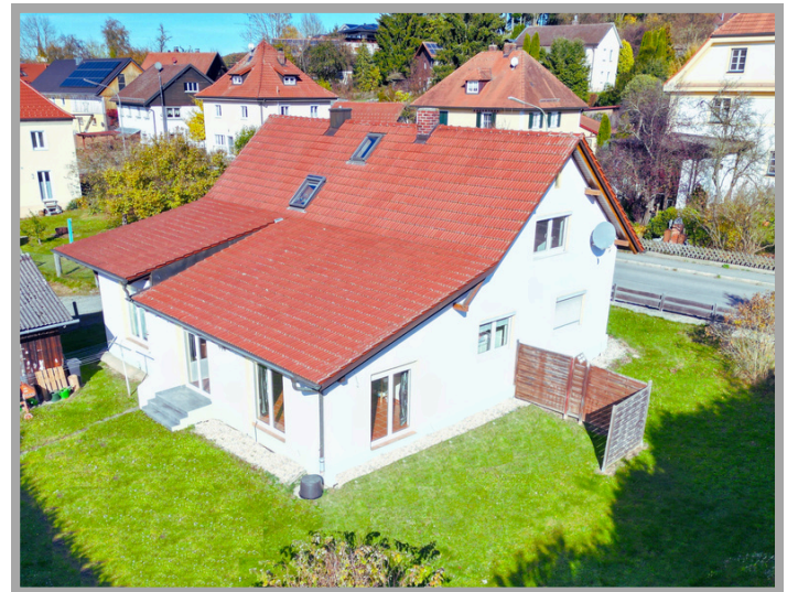
Ansicht auf Haus und Garten

Der zuständige Makler freut sich auf Ihre Anfrage und steht gerne auch telefonisch für Sie zur Verfügung!