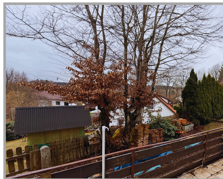
Aussicht von der Terrasse

Grundfläche: ca. 370 qm Wohnfläche: ca. 188 qm Kaufpreis: 159.000 € Baujahr Wohnhaus: ca. 1900 Zuletzt modernisiert: 2023 Provision: 3,57% inkl. MwSt. Energieausweis: Bedarfsausweis Baujahr Wärmeerzeuger: ca. 2023 Energieträger: holz Energieeffizienzklasse: G Energiebedarf: 219,61 kWh/(m 2 *a) Gültig bis: 25.03.2034