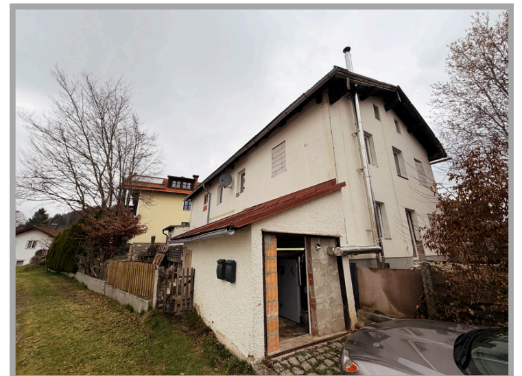
Ansicht von außen Rückseite

Neugierig geworden? Wir freuen uns auf Ihre Anfrage. Nach vollständiger Anfrage erhalten Sie ein Exposé mit noch mehr Informationen zum Objekt.