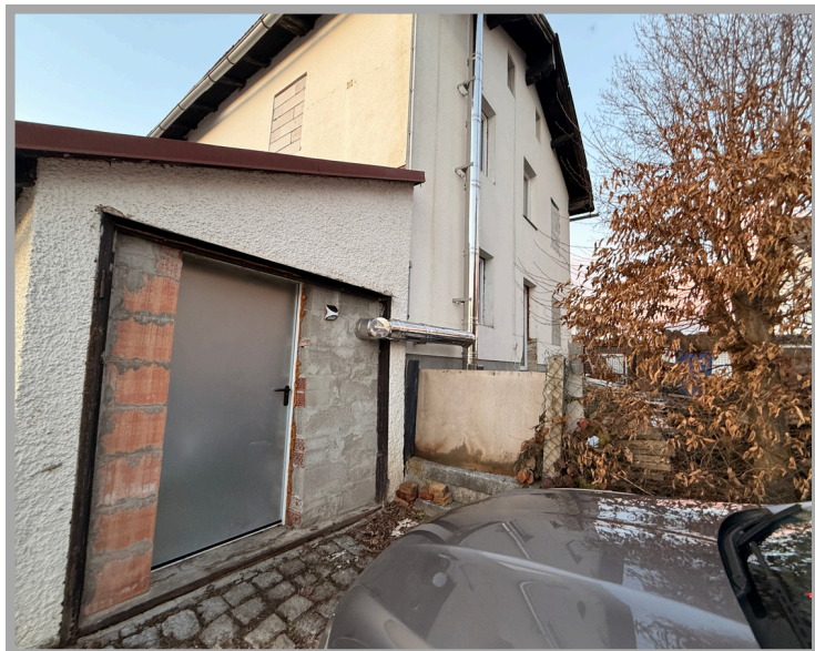
Ansicht auf Anbau