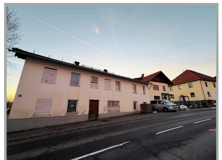
Außenansicht von der Straße aus