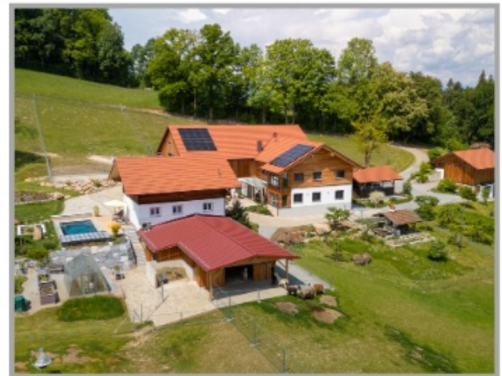
Luftaufnahme vom Sacherl

Jetzt schnell sein! Eine seltene Gelegenheit wartet auf einen neuen Besitzer!