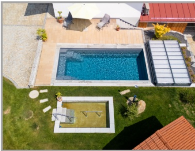
Pool und Kneippbecken