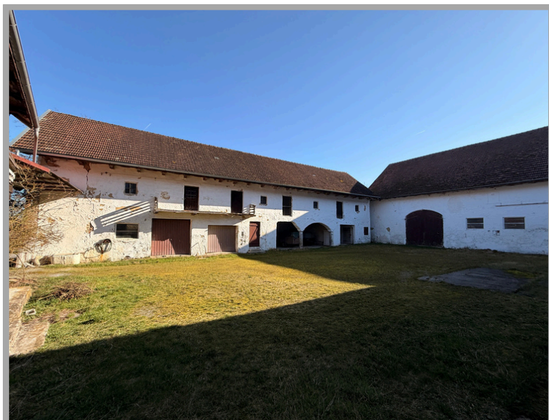
Blick auf das Nebengebäude