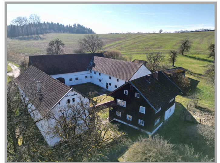
Luftaufnahme vom Vierseithof

Nach Ihrer Anfrage erhalten Sie von uns ein Exposé und ein Datenblatt, mit noch mehr Informationen zum Objekt. Der zuständige Makler freut sich auf Ihre Anfrage und steht gerne auch telefonisch für Sie zur Verfügung!