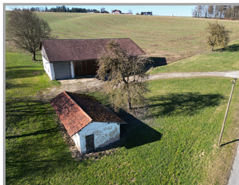
Ansicht auf Maschinenhalle