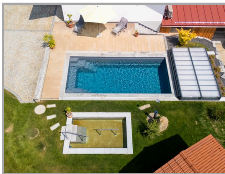
Pool und Kneippbecken