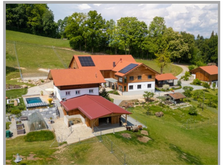
Luftaufnahme vom Sacherl

Jetzt schnell sein! Eine seltene Gelegenheit wartet auf einen neuen Besitzer!