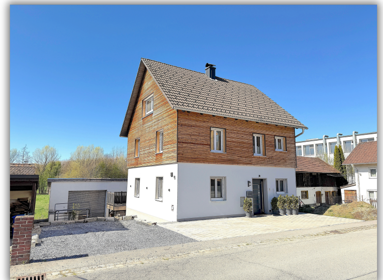
Ansicht von außen

Das Grundstück lädt mit seinem gepflegten Garten zum Entspannen, Spielen und Genießen im Freien ein. Eine Garage sorgt für komfortables Abstellen Ihres Fahrzeugs und bietet zusätzlichen Stauraum für Fahrräder, Gartengeräte und mehr.