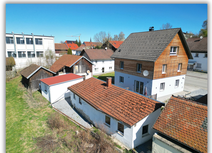
Ansicht aufs Haus von oben

Neugierig geworden? Wir freuen uns auf Ihre Anfrage.