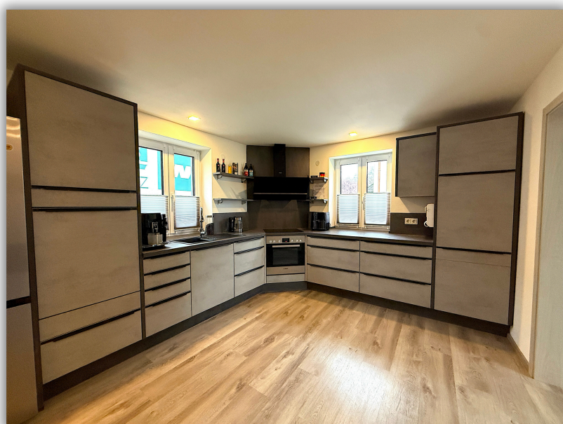
Einblick in die Küche