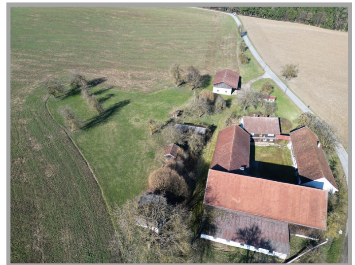
Luftaufnahme vom Vierseithof

Der zuständige Makler freut sich auf Ihre Anfrage und steht gerne auch telefonisch für Sie zur Verfügung!