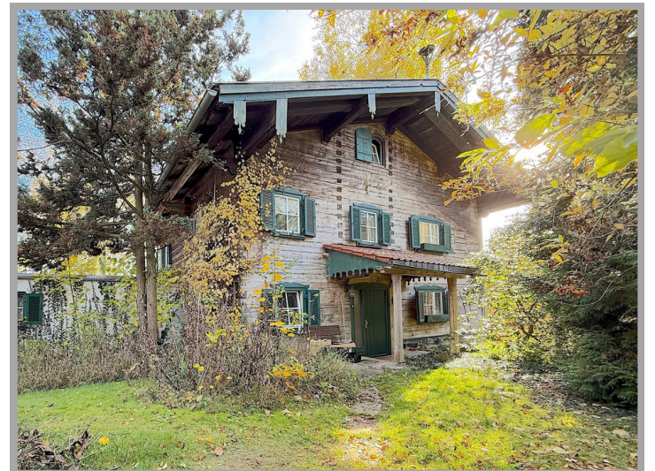
Ansicht von außen

Wir freuen uns auf Ihre Anfrage und Ihnen schon bald dieses Objekt vorstellen zu dürfen!