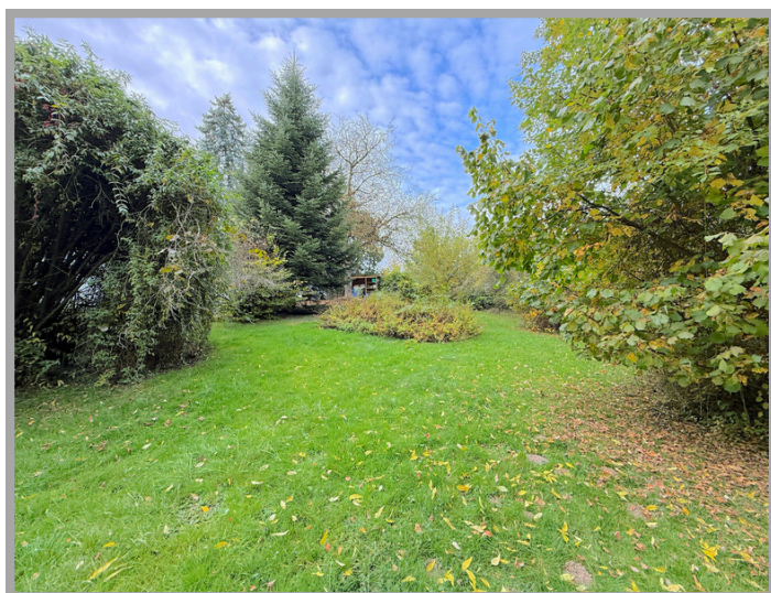
Einblick in den Garten