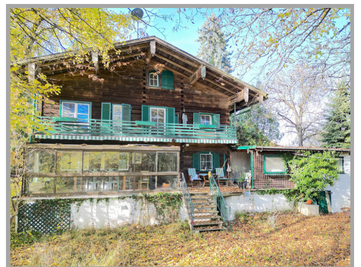
Ansicht von der Rückseite