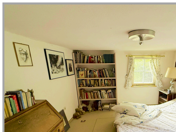
Zimmerbeispiel im Obergeschoss

Ruhig, naturverbunden und traditionsbewusst liegt die Gemeinde und ist trotzdem in der Nähe zu kleineren Städten wie Haarbach oder Bad Griesbach, aber ist dennoch verkehrlich gut angebunden.