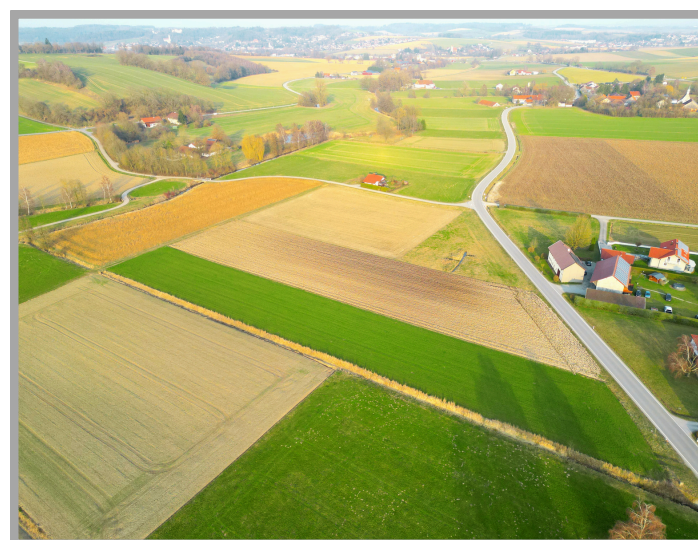
Luftaufnahme mit Umgebung

Die Zustandsstufe 4 weist auf eine gute Ertragsfähigkeit mit einer rund 30cm starken Krume hin, wodurch dauerhaft stabile und hohe Erträge erzielt werden können.