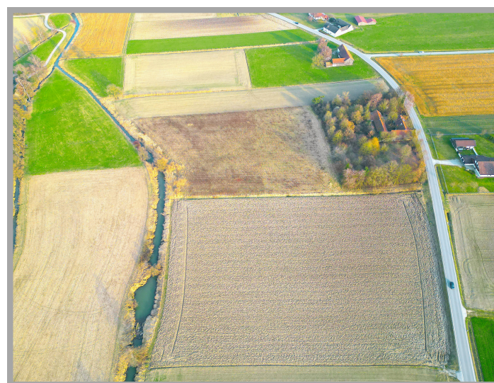
Blick auf Ackerflächen