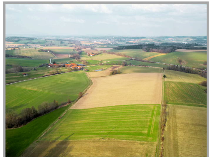
Luftaufnahme mit Umgebung

Die Zustandsstufe 4 weist auf eine gute Ertragsfähigkeit mit einer rund 30cm starken Krume hin.