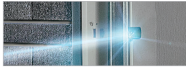
LICHTSCHRANKE FÜR GARAGENTORE