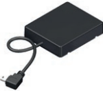
NOVOFERM HOMEMATIC IP MODUL