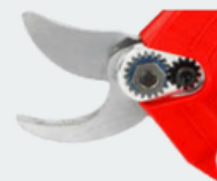
CUCHILLA DE ACERO SKS-5