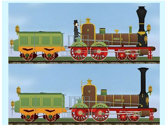
Oben die "RHEIN" mit Lokpersonal, unten die "REUSS" (mit geändertem Schornstein).