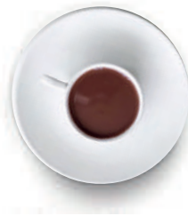
Chocolate a la Taza