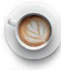
Descafeinado con Leche