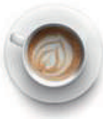
Café con leche