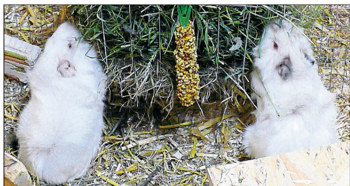
Wenn es um das Organisieren von Futter geht, sind Findus und Kasimir recht erfinderisch.

Für die in der vorigen Woche vorgestellte Katze Lilly hat niemand angerufen.