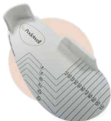
PEDIWELL disponible en commande

Nous avons développé un pédimètre exclusif, le PédiiWell, qui permet de mesurer la longueur et la largeur du pied. Grâce au PédiiWell, couplé à un guide de taille exhaustif, vous pouvez commander le modèle le plus adapté pour votre patient dans la bonne pointure.