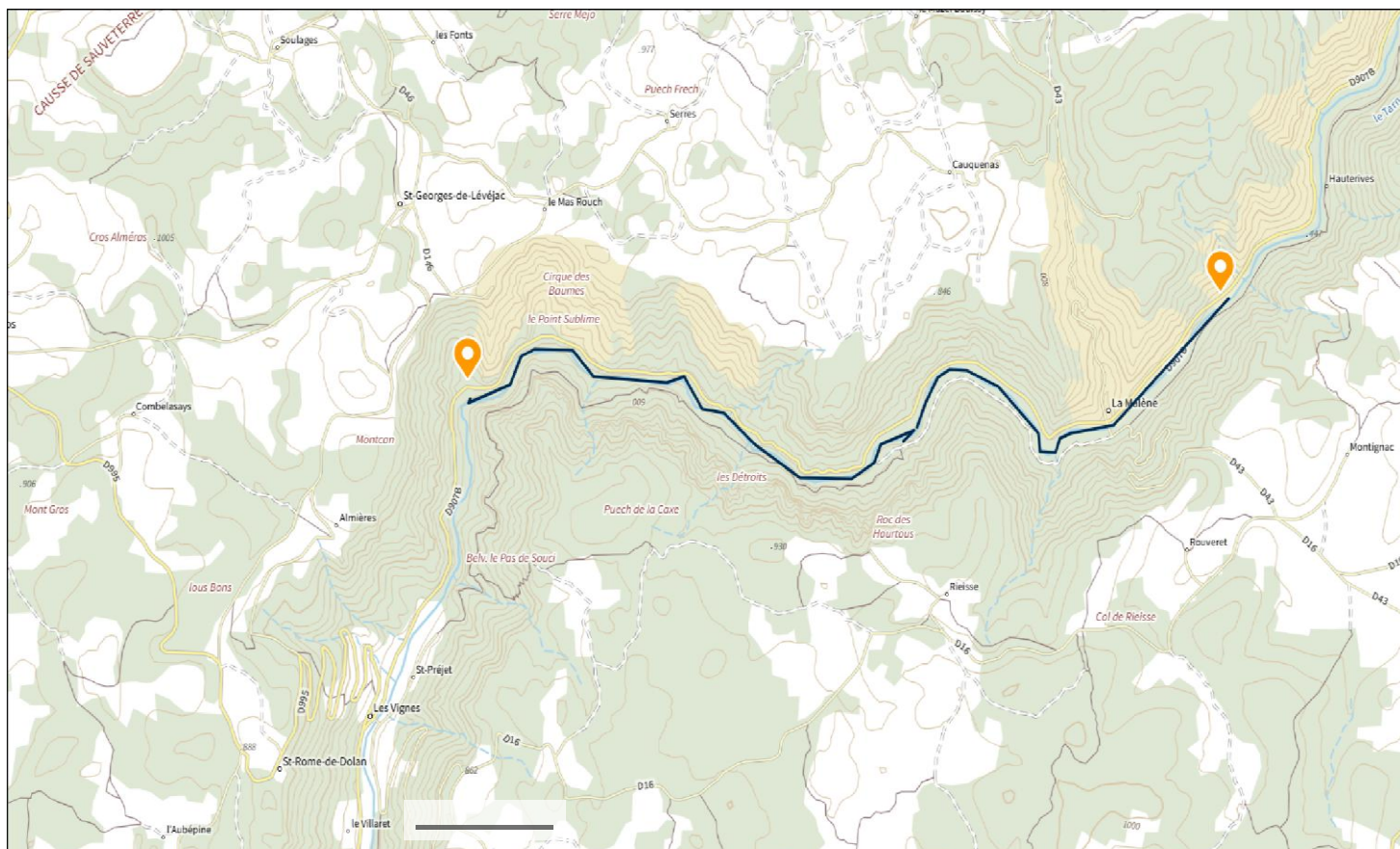
Itinéraire de la descente du Tarn