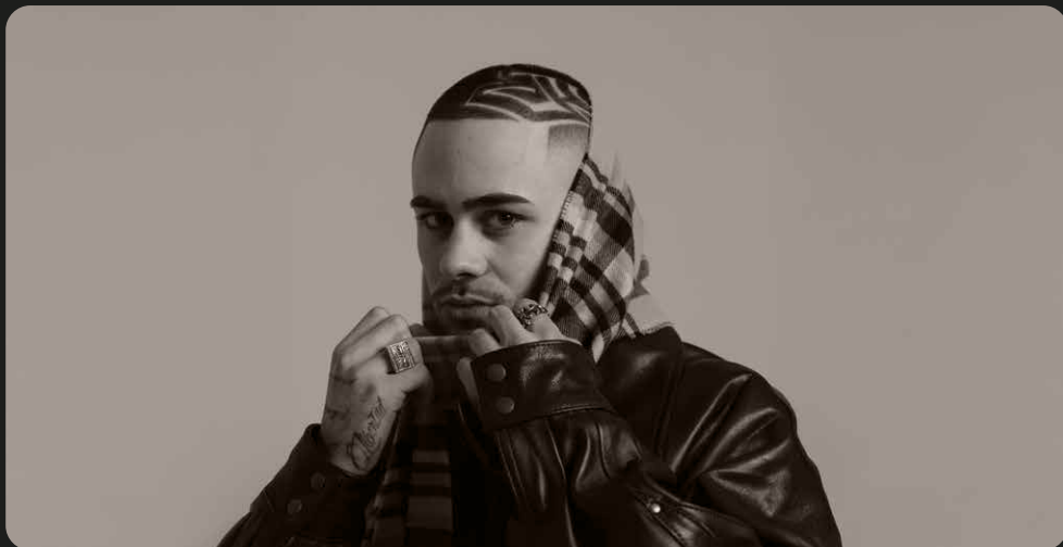
Balance Collection by Nabil Bony