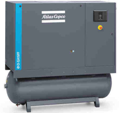
Vis G/GA sur cuve