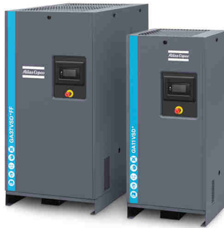
Vis GA VSD+