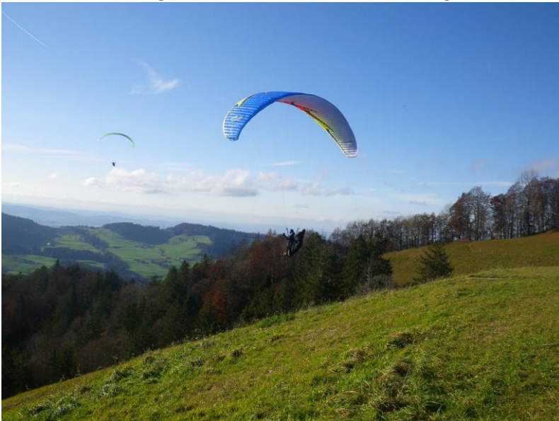
Gleitschirmflieger auf der Alp Scheidegg