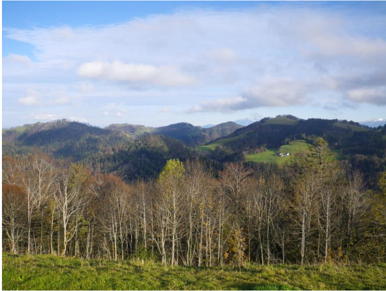
Prächtiges Panorama über bewaldete Hügel