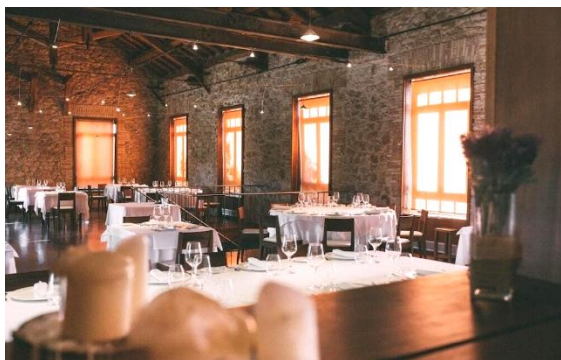
Rustikales Ambiente, Restaurant Fuente Aceña

1998 Pingus, Ribera del Duero: Aufhellendes Granat, feiner Wasserrand aussen. Delikates, facettenreiches Bouquet, offen, ausladend, füllig und minim laktisch. Das erinnert dann irgendwie an ein stichfestes Mocca-Joghurt. Im zweiten Ansatz; Lakritze und Earl-Grey, sowie Spitzwegerich Bonbons. Im Gaumen superelegant, saftig und lang. Kein grosser Ribera-Jahrgang, aber ein wunderbarer Wein der Emotionen und Spass gleichzeitig abliefern. Irgendwie erinnerte mich das Ganze an einen Palmer 1998. 19/20 trinken