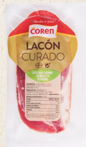
LACÓN CURADO TROZO