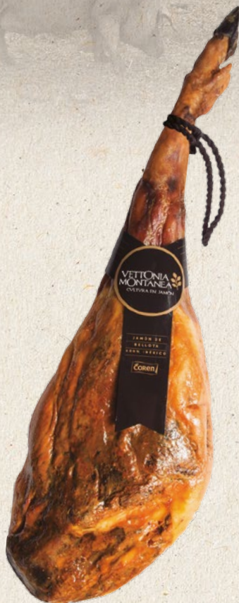
JAMÓN DE BELLOTA 100% IBÉRICO