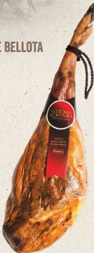
JAMÓN DE BELLOTA IBÉRICO 50% RAZA IBÉRICA