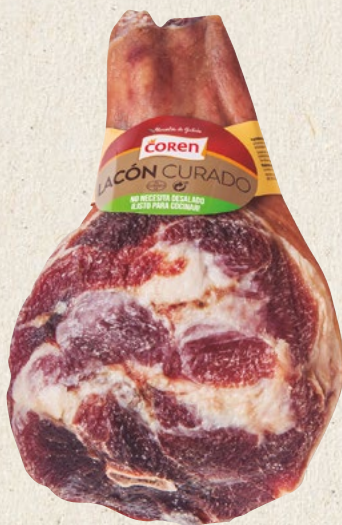
LACÓN CURADO SIN PATA