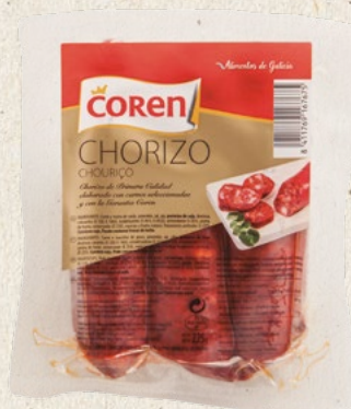
CHORIZO AHUMADO 3 Uds.