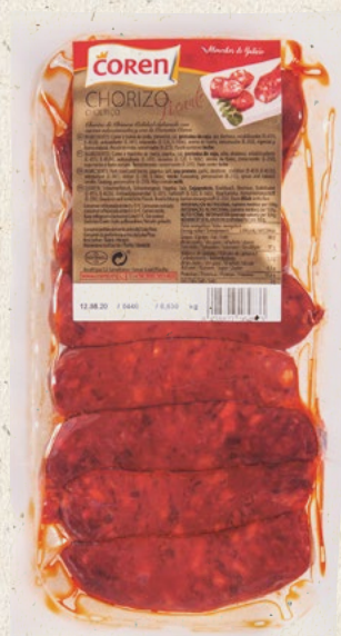
CHORIZO AHUMADO 8 Uds.