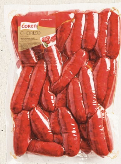
CHORIZO AHUMADO 3-3,5 Kg