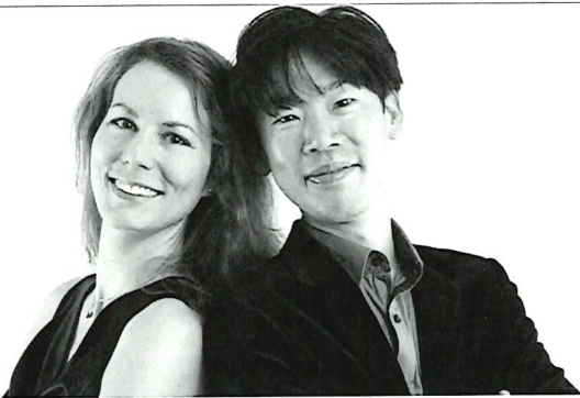
Duo Four Te

Sonntag, den 01.03.2026 um 16:00 Uhr "Weltklassik Klavierduo - Schwanensee und Donauwalzer!"