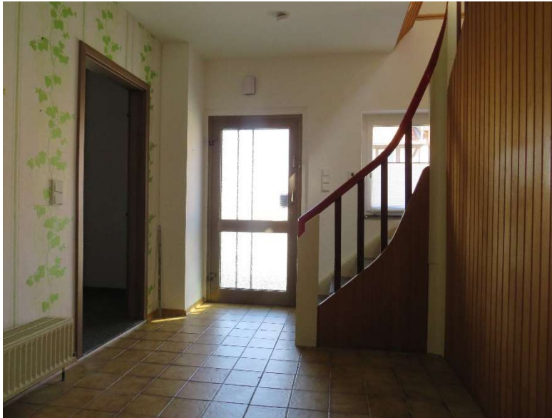
Eingangsbereich DH 2