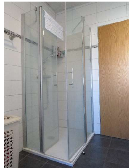
Bad im EG DH 1