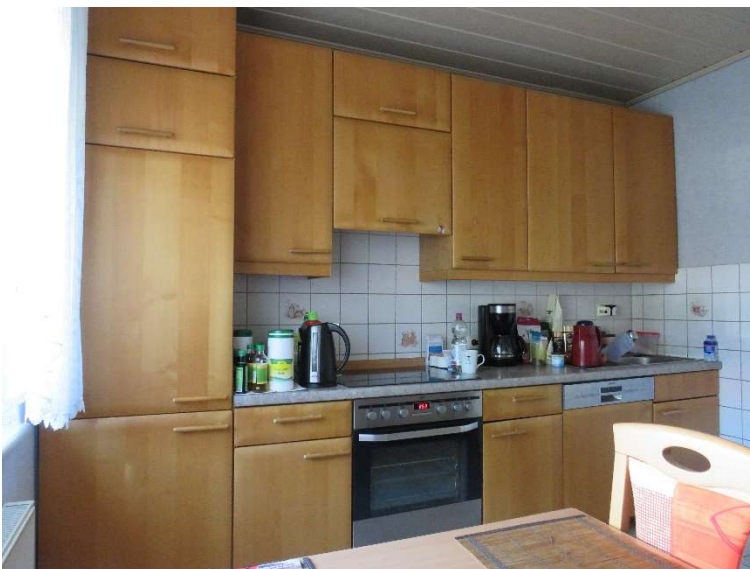
Küche DH 1