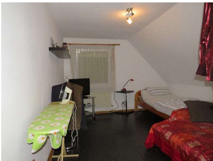
Schlafrum 2 im OG DH 1