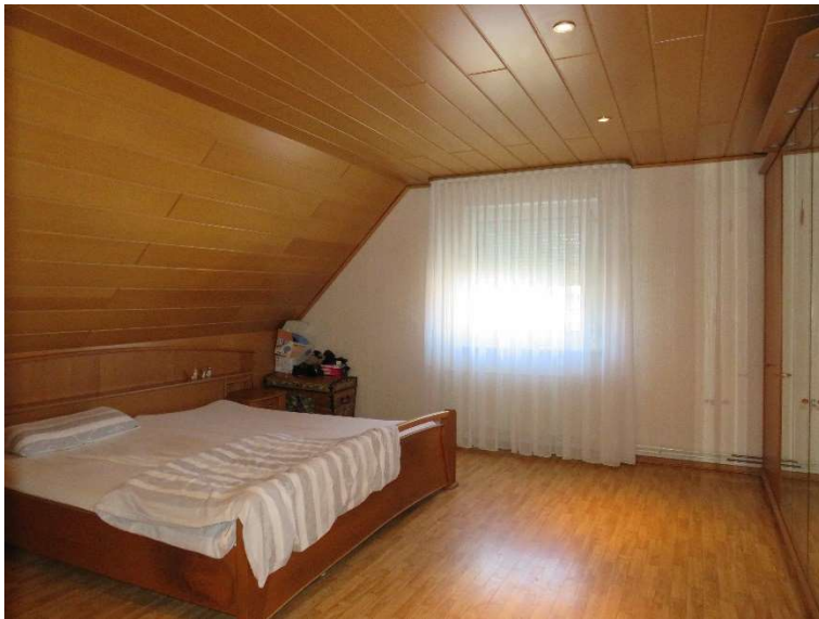
Schlafrum 1 im OG DH1