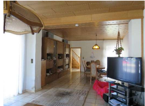
Wohnzimmer DH 1