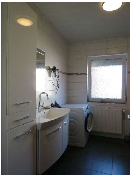
Bad im EG DH 1