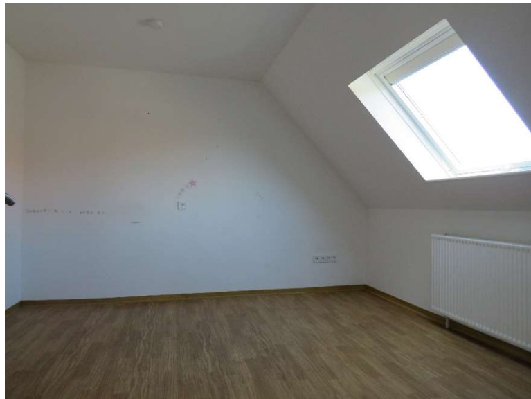
Schlafraum 1 im OG DH 2