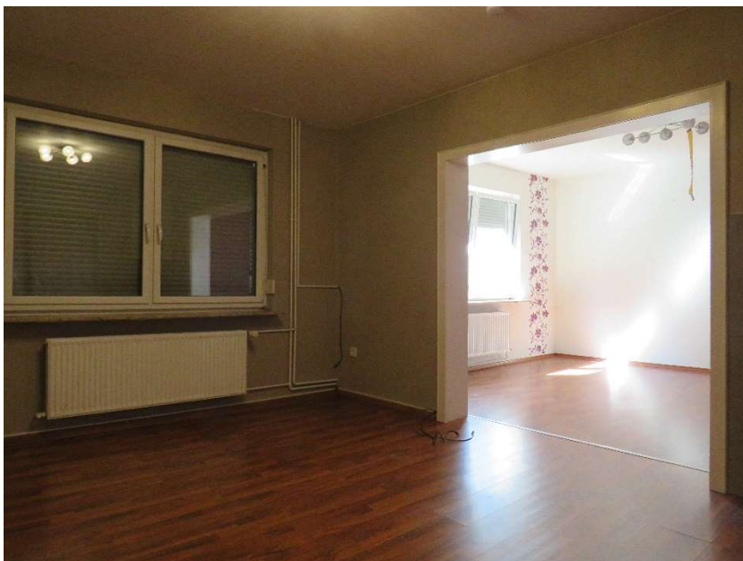
Wohn- und Esszimmer DH 2