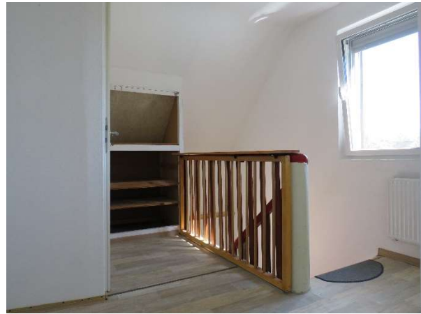
Flur im OG DH 2