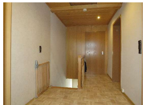
Flur im OG DH 1