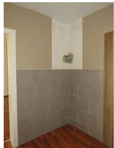
Kaminanschluss DH 2