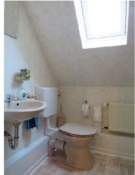
Gäste-WC im OG DH 1