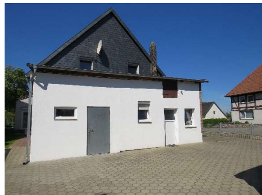
Anbau mit Anschlussraum u. Werkstatt