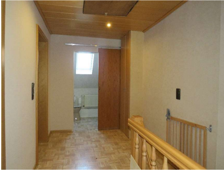
Flur im OG DH 1