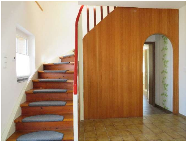
Flur im EG und Treppe zum OG DH 2