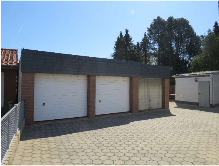
Innenhof mit Garagen