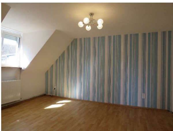
Schlafraum 2 im OG DH 2