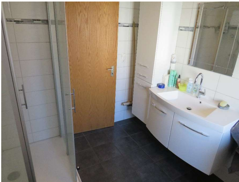
Bad im EG DH 1