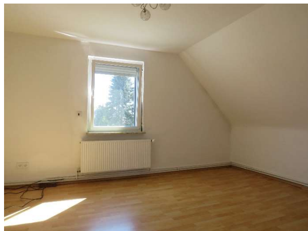
Schlafraum 3 im OG DH 2