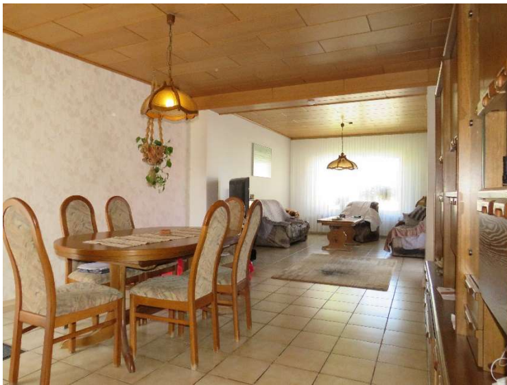
Wohnzimmer mit Essbereich DH 1