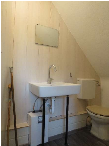
Gäste-WC im OG DH 2