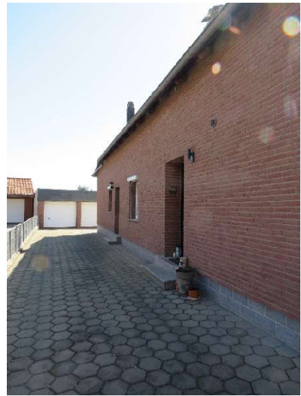
Eingangsbereiche zu den DHH