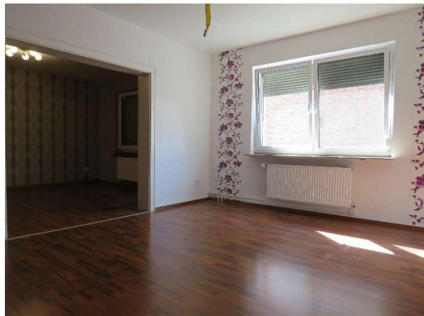
Wohn- und Esszimmer DH 2