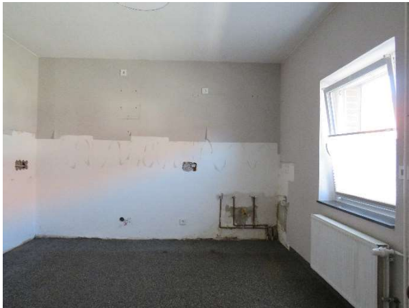
Küche DH 2