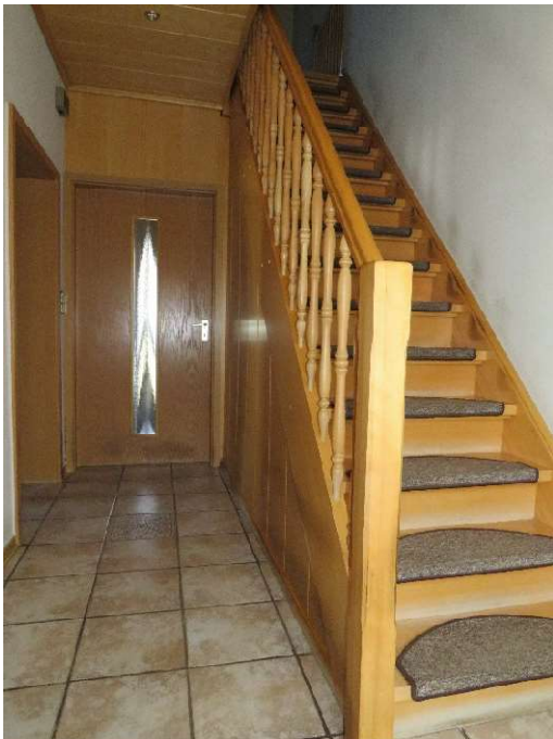
Eingangsbereich DH 1