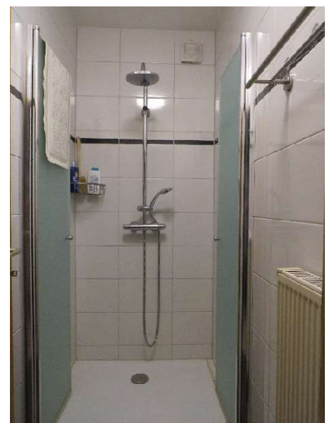
sep. Dusche im EG DH 1