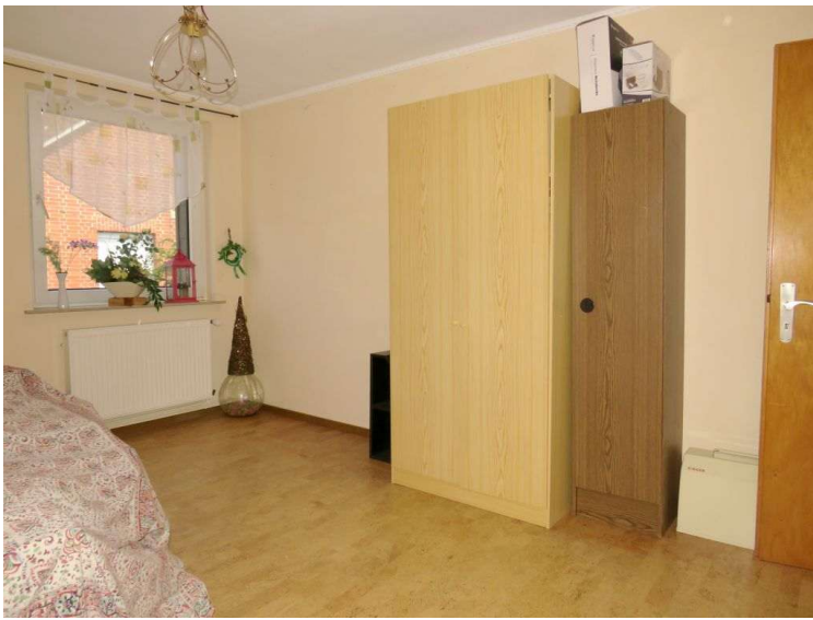
Schlafen 3 im OG