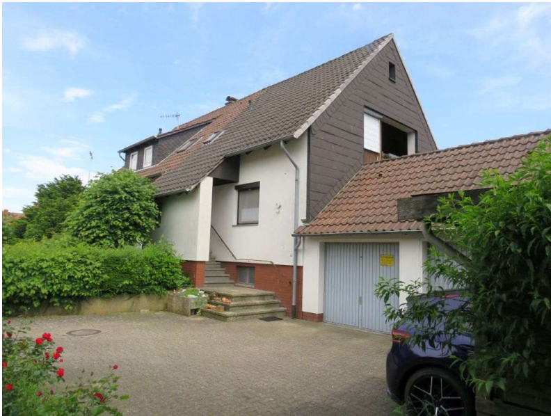
Hof mit Zugängen zum Haus, zu den Garagen und zum Garten