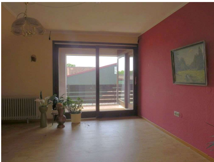
Schlafen 2 im OG mit Zugang zum Balkon