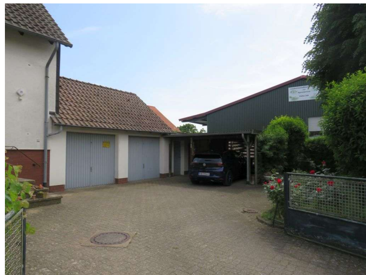
Hof mit Garagen und Stellplätzen