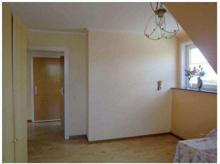
Schlafen 3 im OG