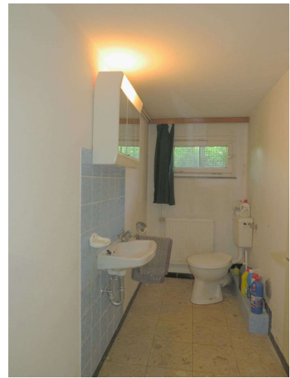
Gäste-WC im Keller