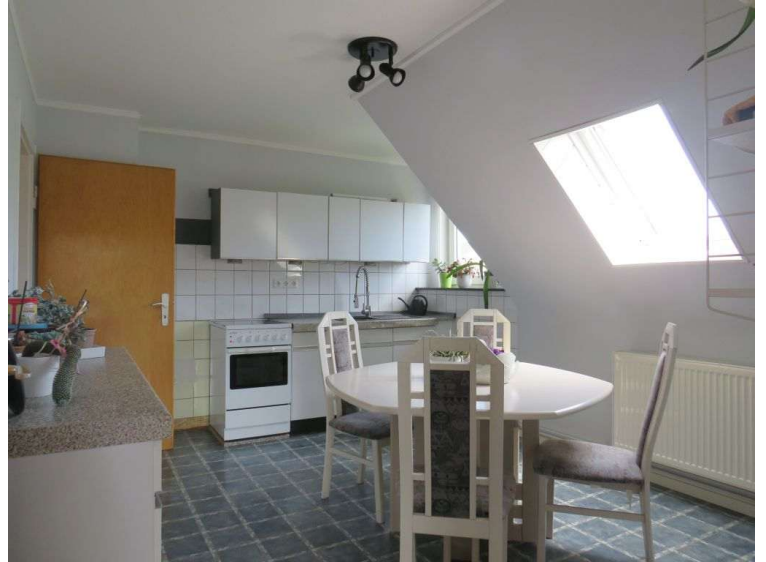
Küche im OG