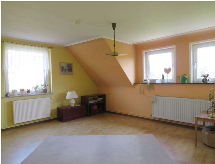
Wohnzimmer im OG