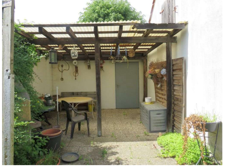
Außensitzbereich mit Zugang zum Hof