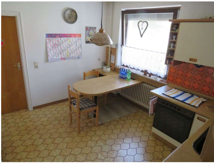
Küche im EG