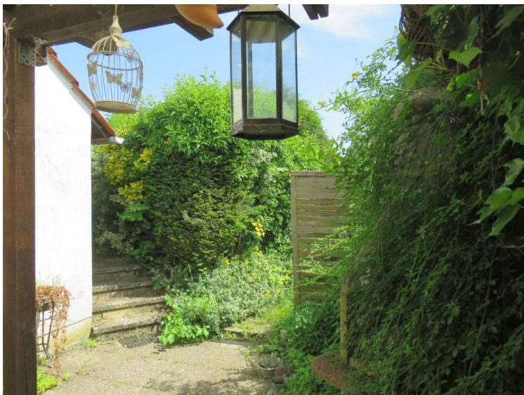
Außensitzbereich mit Zugang zum Garten