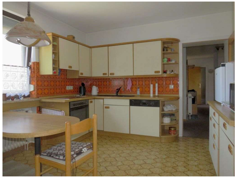
Küche im EG