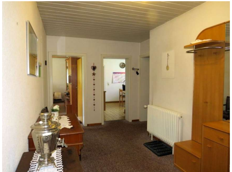
Flur im EG