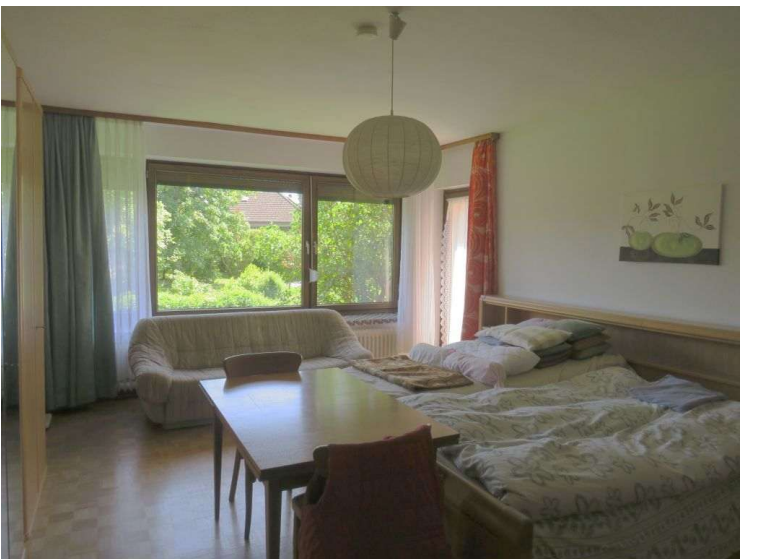
Schlafen 2 im EG