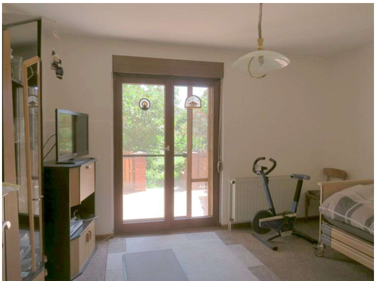
Schlafen 1 im EG