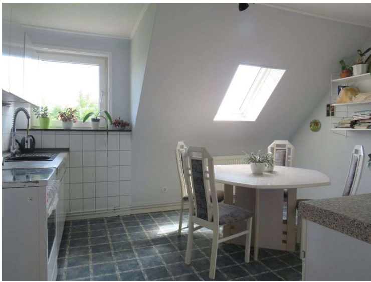
Küche im OG