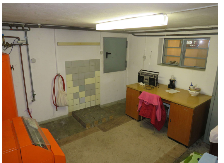
Heizungsraum im Keller