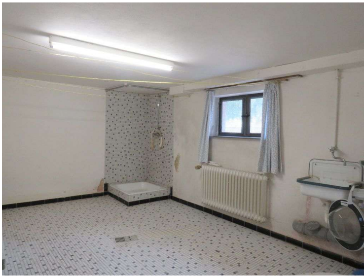
Anschlußraum im Keller