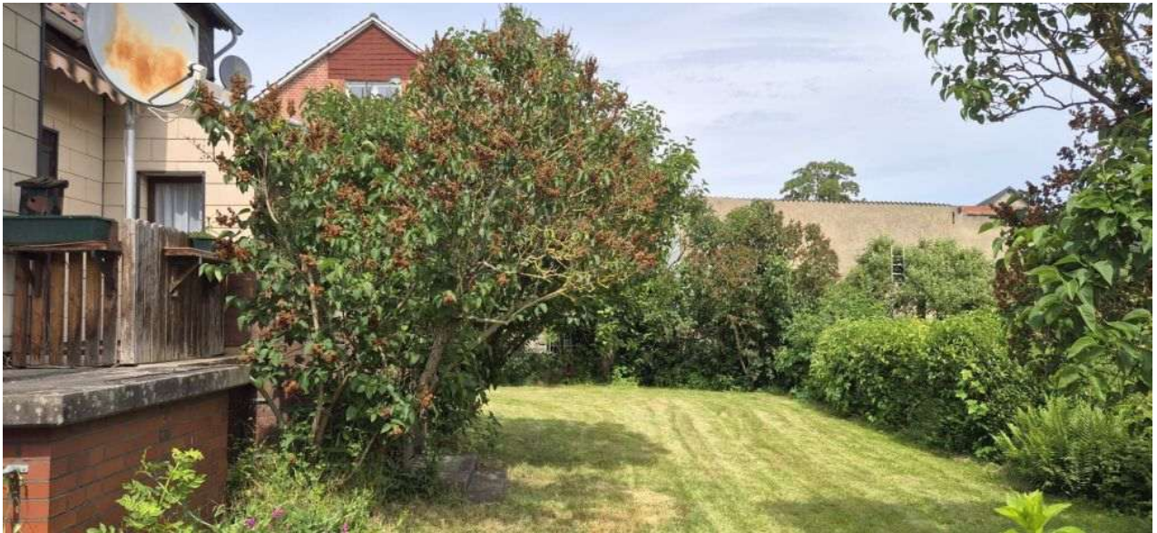
Gartengrundstück mit Sicht zur Terrasse Südseite