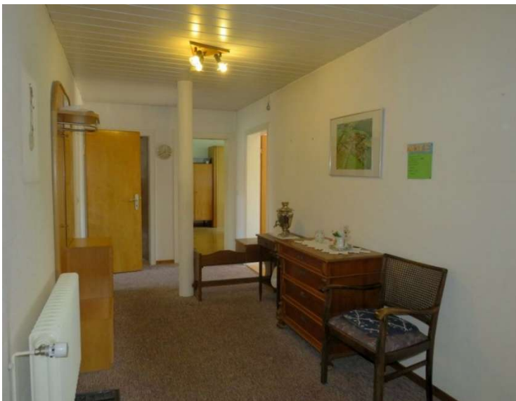
Flur im EG