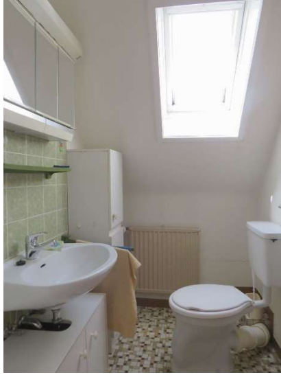
Gäste-WC im OG