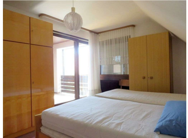
Schlafen 1 im OG mit Zugang zum Balkon