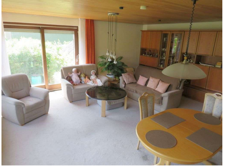
Wohnzimmer im EG