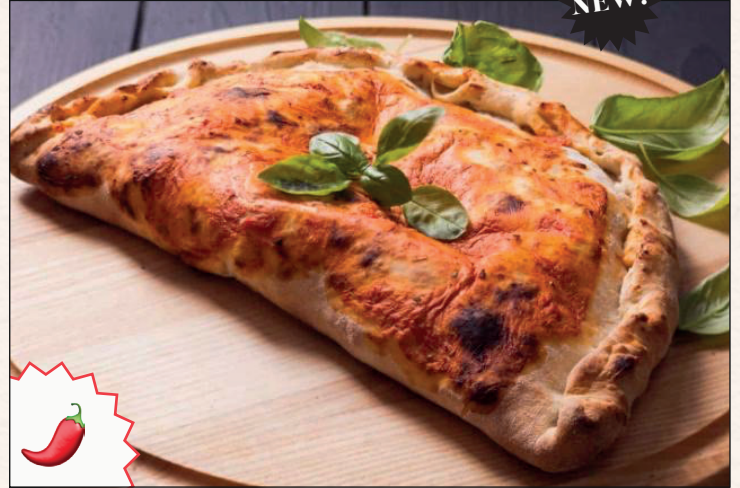
CALZONE TIAMO 15,90€

Muuuucha mozzarella, cebolla dulce, ají molido, orégano, olivas verdes "Gordal". Para compartir!