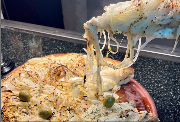
FUGAZZETA RELLENA 29,90€

Muuuucha mozzarella, cebolla dulce, ají molido, orégano, olivas verdes "Gordal". Para compartir!