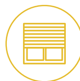
Rund ums Fenster

Somfy bietet Ihnen ein umfassendes Produktsortiment für ein smartes Zuhause ganz nach Ihren Wünschen.