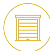
Tore und Türen