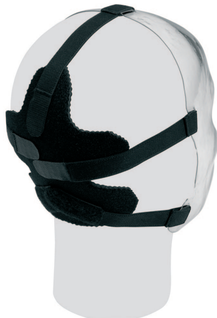
Dynamische Gesichtsmaske Conformateur facial dynamique Conformatore facciale dinamico