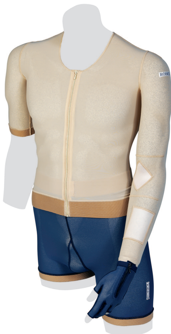
Kompressions-Bandagen nach Verbrennungen Bandages compressifs pour brûlés Bendaggi compressivi per ustioni