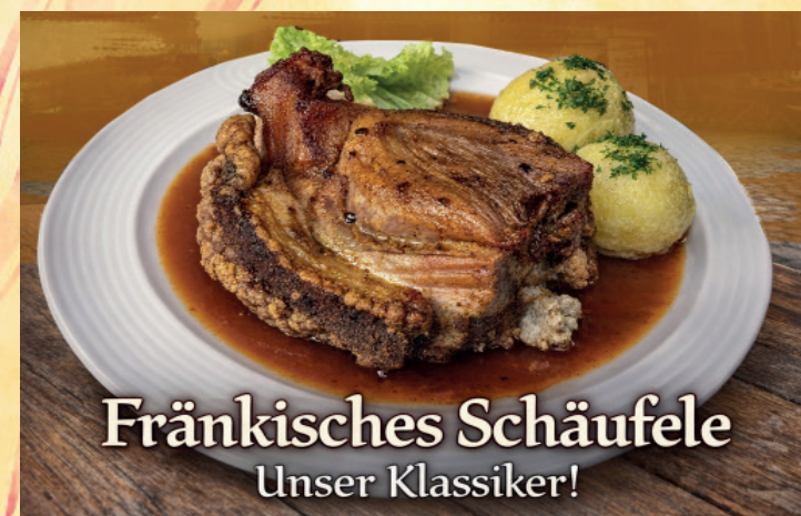
Fränkisches Schäufele Unser Klassiker!