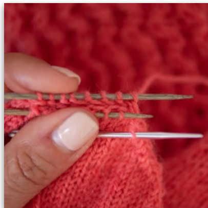
5. ... die M von der Nadel heben und Faden durchziehen