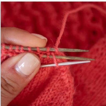
4. Nadel von li nach re in erste vordere M einstechen ...