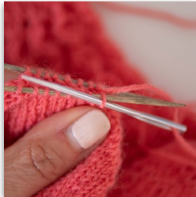
2. Nadel von re nach li in die erste vordere M einstechen und Faden durchziehen, Masche bleibt auf der Stricknadel liegen