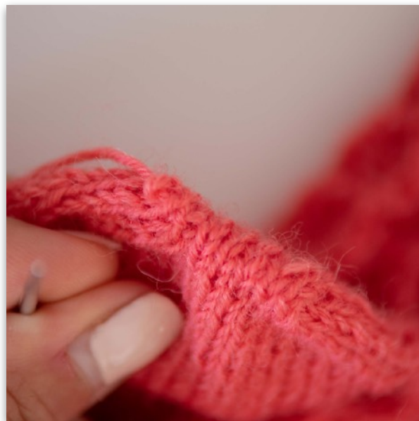
10. fertiger Maschenstich

Nachdem du einmal alle Schritte gearbeitet hast, wiederhole die Schritte 4-9 bis nur noch jeweils 1 Masche auf jeder Nadel liegt. Dann noch einmal Schritt 4 und 5 und einmal Schritt 7 und 8 wiederholen, den Faden gut festziehen und den restlichen Faden in das innere der Spitze ziehen und vernähen.