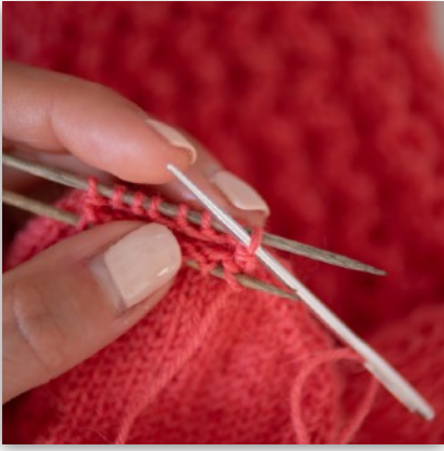
7. Nadel von re nach li durch die erste hintere M ziehen ...