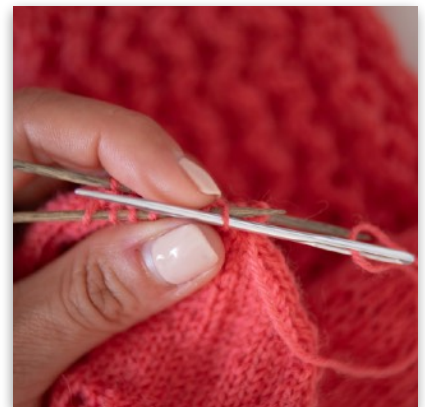
6. Nadel durch die nächste vordere M von re nach li einstechen und Faden durchziehen, Masche bleibt auf der Stricknadel