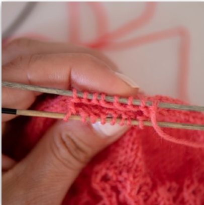
1. 8 M (oder soviel wie es die Anleitung vorgibt) auf jeder Nadel

Der Maschenstich sorgt für einen nahezu unsichtbaren Abschluss und eignet sich wunderbar, um offene Maschen sauber und harmonisch miteinander zu verbinden – perfekt zum Beispiel für Socken, Bündchen oder feine Abschlüsse an Strickstücken.