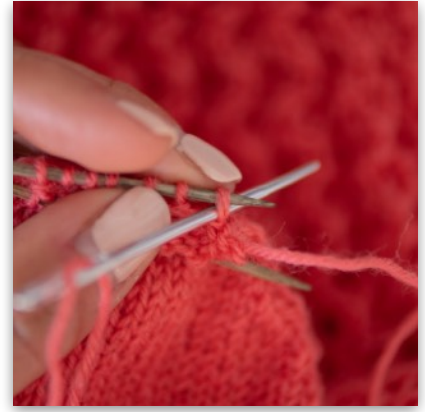
9. Nadel von li nach re in die nächste hintere M einstechen und Faden durchziehen, Masche bleibt auf der Stricknadel liegen

Nachdem du einmal alle Schritte gearbeitet hast, wiederhole die Schritte 4-9 bis nur noch jeweils 1 Masche auf jeder Nadel liegt. Dann noch einmal Schritt 4 und 5 und einmal Schritt 7 und 8 wiederholen, den Faden gut festziehen und den restlichen Faden in das innere der Spitze ziehen und vernähen.