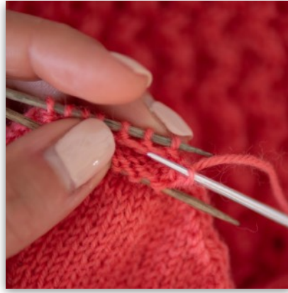
8. ... die M von der Nadel heben und Faden durchziehen