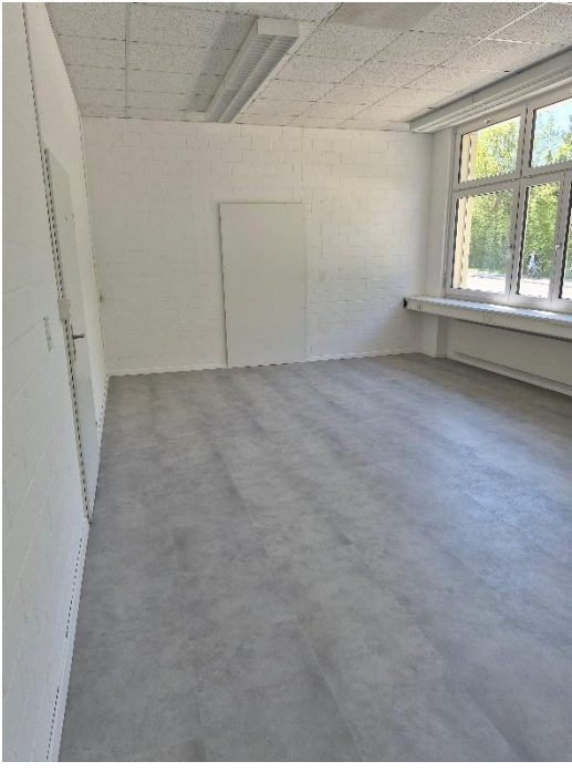
Foto: Entree / Warteraum